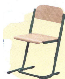
2. Stoliki czteroosobowe i krzeselka z regulowanym siedziskiem